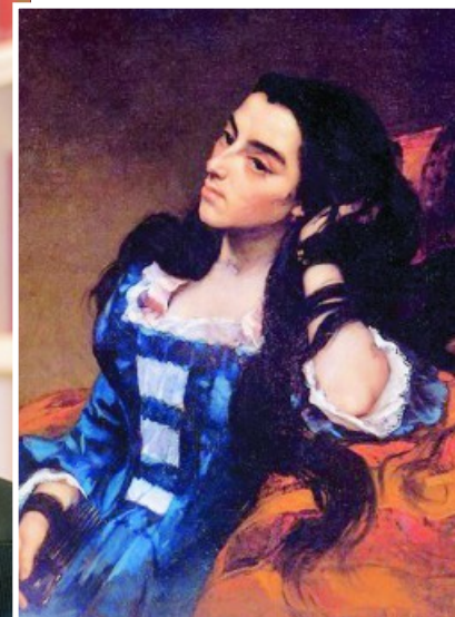
El misterioso cuadro «Mujer española» de Gustave Courbet